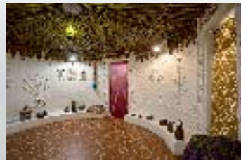
В дворце Индии есть воссозданное в мельчайших деталях традиционное жилище народа Рабари