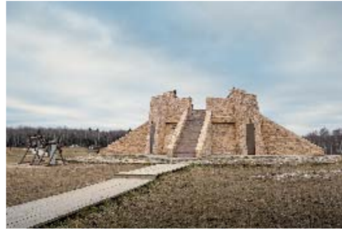
Эта диковинная пирамида – памятник четырем мудрецам. Здесь «встретились» мыслители восточного полушария. Россию представляет Серафим Саровский. На другом конце парка есть еще одна точно такая же пирамида, которая представляет мудрецов Америки, Африки и Европы

6,2 л на 100 км пути расходует Suzuki SX4 в комбинированном цикле